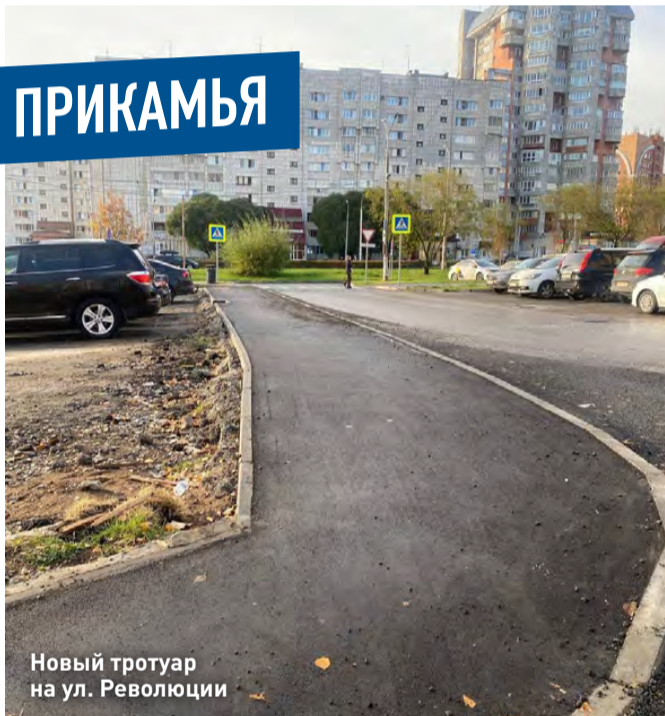
Новый тротуар на ул. Революции